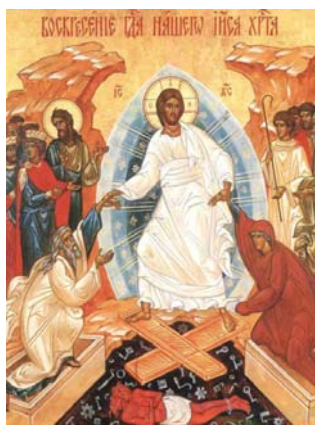
Храм Воздвижения Креста Господня в Алтуфьево